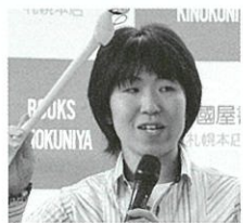
久井 貴世 ひさい あつよ

1961年に東映映画「あれが港の灯だ」でデビュー、俳優として様々な分野で活動する一方、山梨県八ヶ岳南麓にギャラリー&レストラン「八ヶ岳倶楽部」を運営し、雑木林の再生に取り組んでいる。